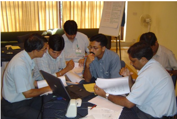
Training von Umweltbeauftragten in New Delhi

Wir organisieren für Sie auch Workshopreihen mit praktischer Umsetzung im Unternehmen zu von Ihnen benötigten Themen.